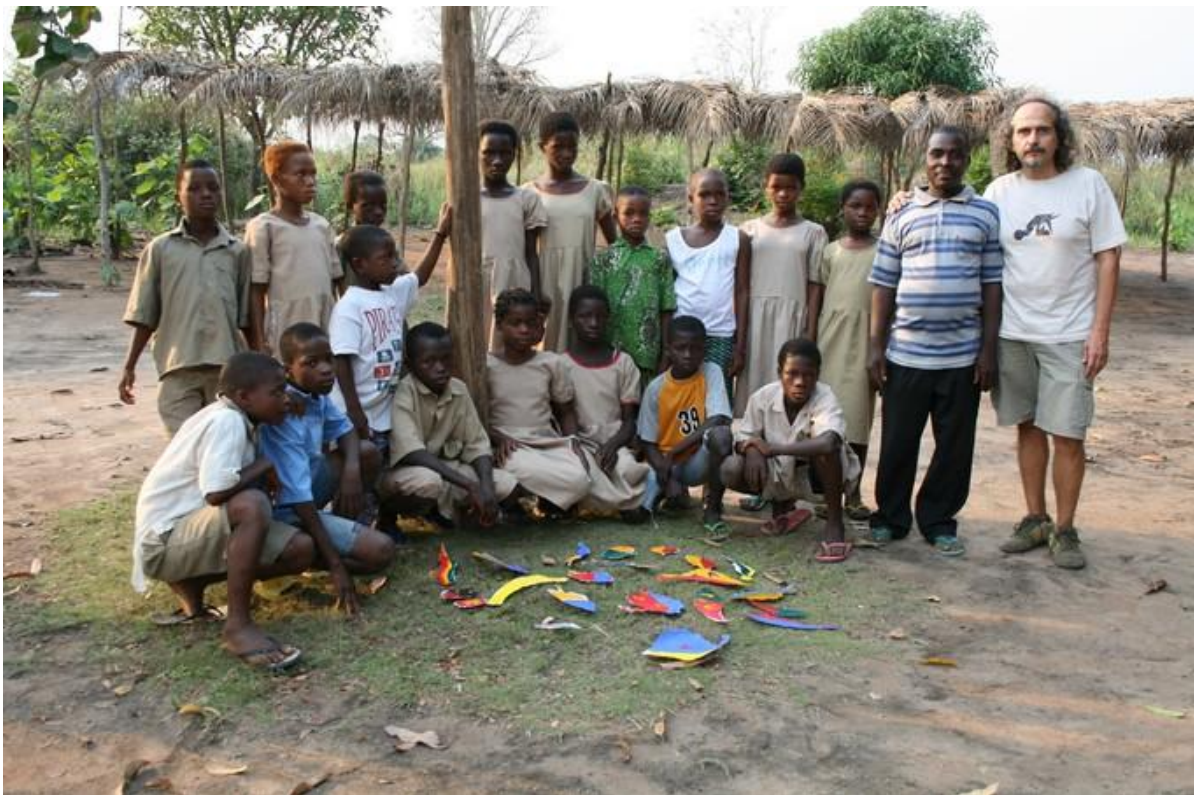
Avec les enfants d'Alakbadja, 2009

Son combat, il le mène avec un pinceau et de la peinture. D'abord en mettant à profit une partie de la vente de ses œuvres pour la réalisation de projets humanitaires, mais aussi en réalisant des ateliers avec les enfants dans les villages de l'entité de Hekpe, mettant à leur disposition une nouvelle forme d'expression.