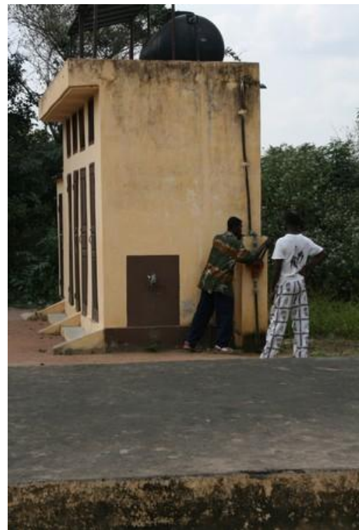
Sanitaires + panneaux solaires