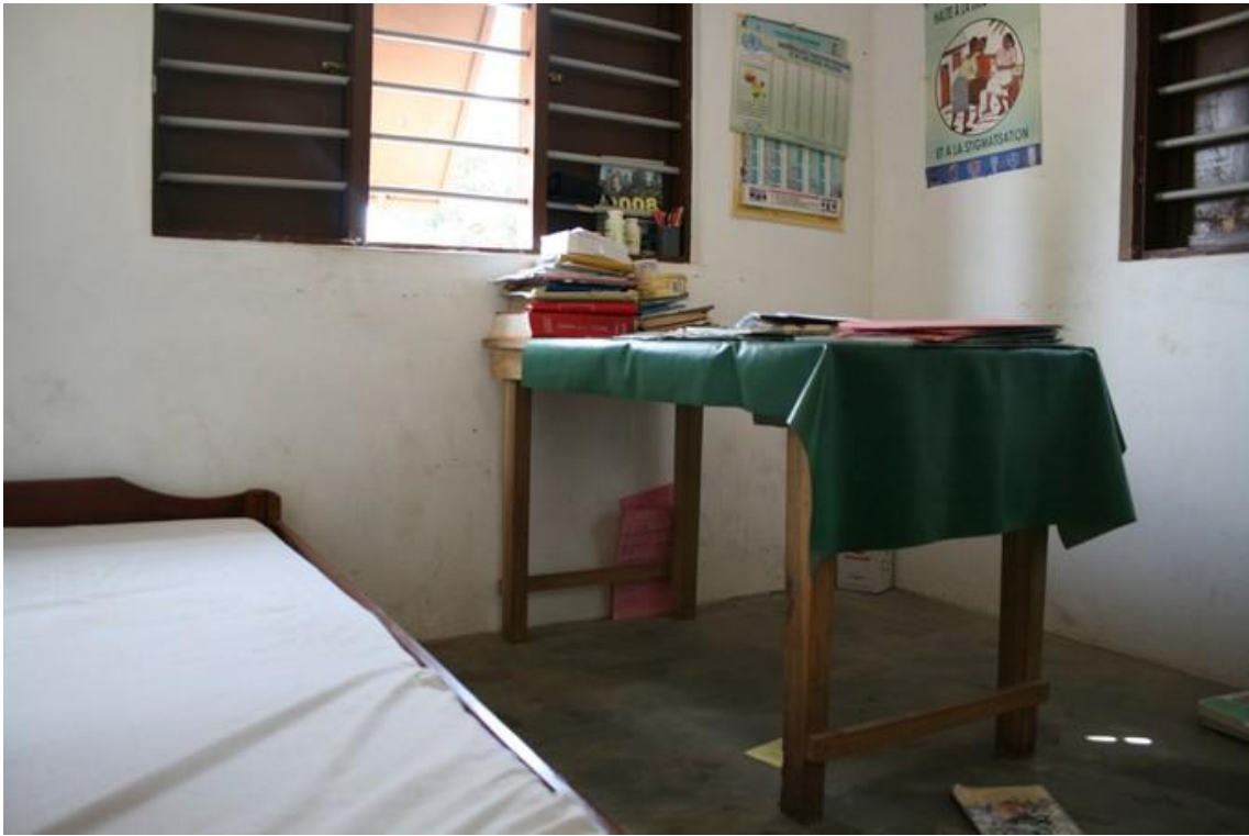
Salle de consultation prénatale