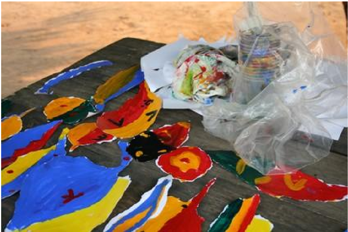
Atelier avec les enfants d'Alakbadja, 2009