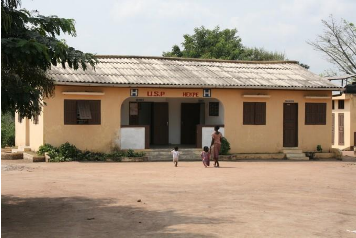
Vue extérieure du dispensaire inauguré en 2006