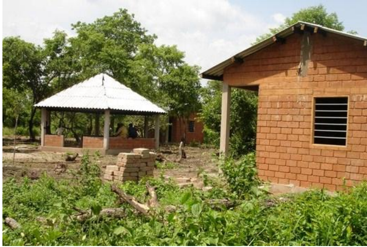
Vue du village – projet Gododo (Entité de Hepke)