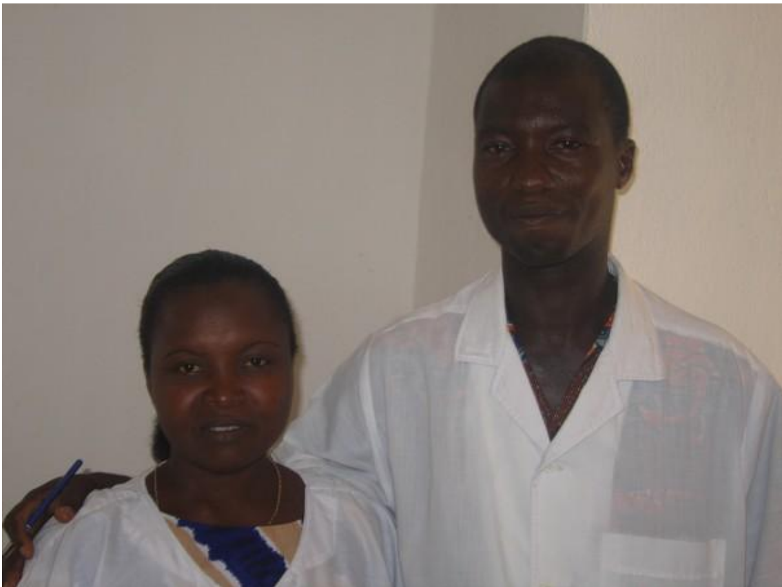
L'accoucheuse et l'infirmier du dispensaire