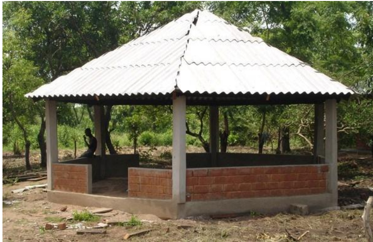
Salle de réunion en plein air