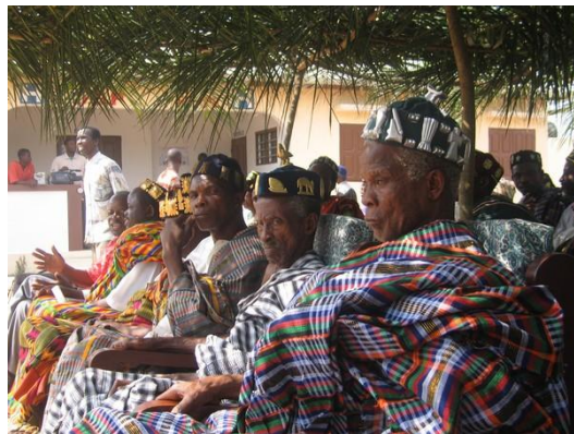
Les chefs de village de l'entité de Hekpe

La bibliothèque sera construite à Fokpo2, l'un des villages de l'entité de Hekpe (12 villages en tout). Conçue comme un lieu de rencontre entre lecteurs, elle pourra également servir de lieu de réunion pour les associations de femmes ou de jeunes (entre autres). Les événements récréatifs qui pourront s'y tenir (musique, danse, projection de film, ...) permettront d'enrayer le phénomène d'exode rural.