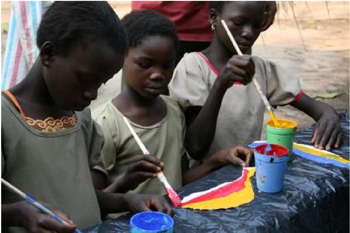
Atelier avec les enfants d'Alakbadja, 2009